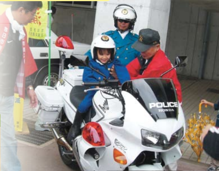
※写真は昨年開催のものです。